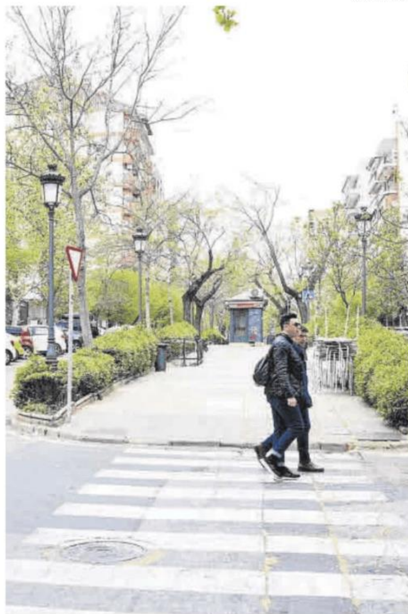
Imagen de la avenida Virgen de la Montaña.

El proyecto de remodelación de Virgen de la Montaña pretende diseñar una nueva definición de los carriles de circulación, sentidos, aparcamientos, zonas de carga y descarga, ubicación de contenedores. Sobre la remodelación de la Plaza Marrón y Camino Llano en este caso es necesario tanto la renovación como la mejora la pavimentación de la calzada y las aceras, como de algunos tramos de los servicios existentes de abastecimiento, saneamiento y alumbrado público. La presencia del Museo Helga de Alvear, los nuevos requerimientos de la circulación de vehículos y los cambios introducidos en la normativa de accesibilidad «obligan a modificar la estructura de esta calle y plaza para hacerla más sostenible».