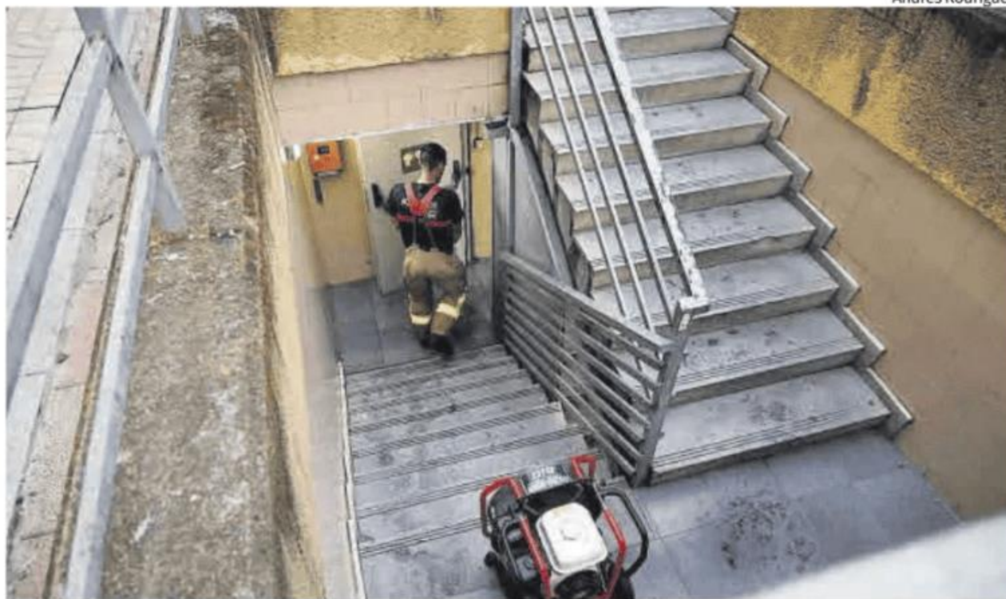
El vehículo incendiado estaba junto al acceso más próximo al hospital, por el que entraron los bomberos.

El vehículo afectado es un Toyota Hilux, pick-up, de color blanco. Sus propietarios, un padre y un hijo de Talavera, acababan de estacionarlo y se encontraban tomando un café en el kiosko de la plaza, por lo que fueron testigos de la llegada de los cuerpos de seguridad y posterior cierre del aparcamiento. Aunque había posibilidad de que su vehículo fuese el afectado, no lo confirmaron hasta que recibieron una llamada de la Policía Local de Talavera, avisándoles