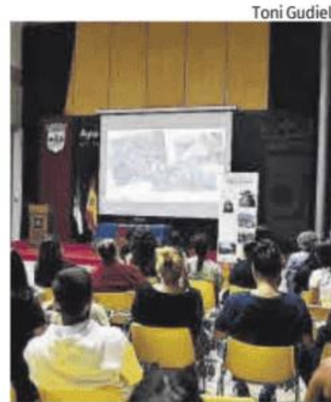
Presentación de la exposición.