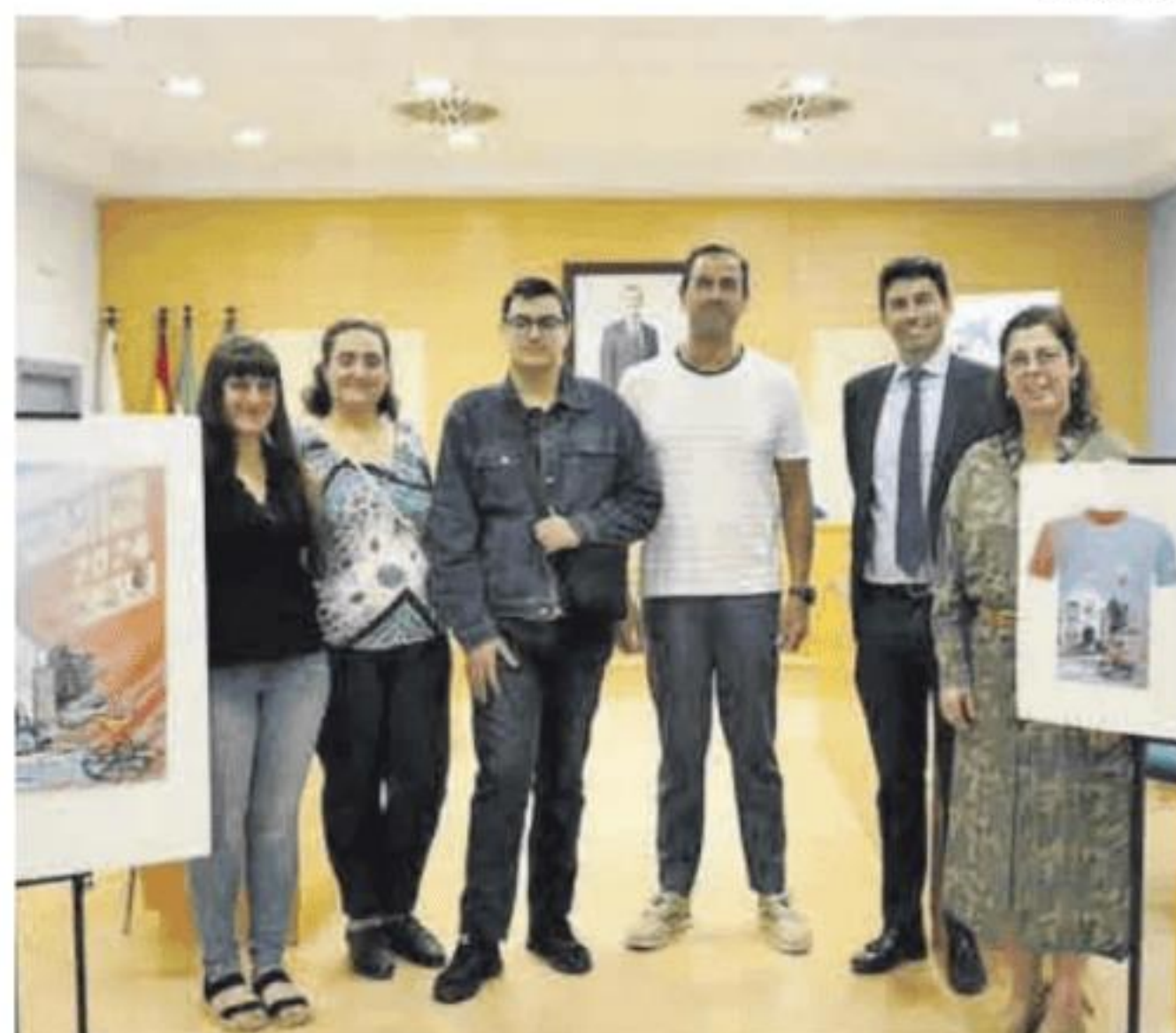
Presentación de la XXV edición de la San Silvestre.

También habilitarán una fila cero para participar en la donación y no en la carrera como tal. ■