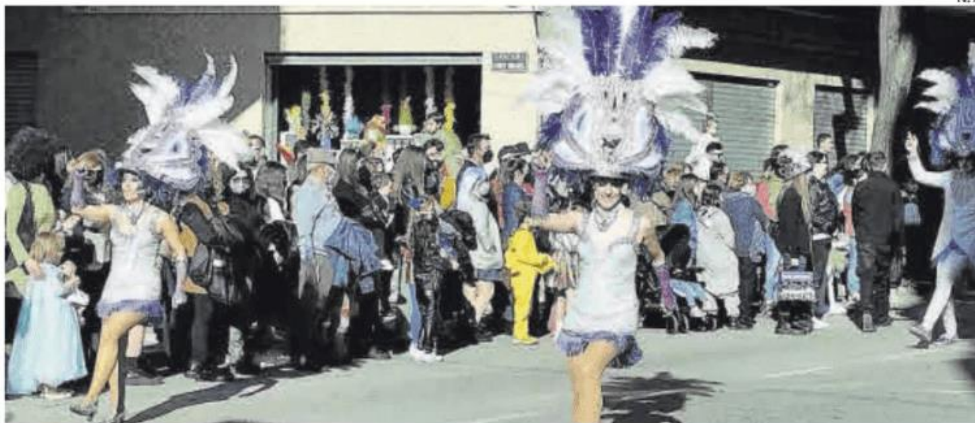
Participantes, durante el Carnaval de la edición pasada en Navalmoral.

El plazo para la presentación de trabajos finalizará el 29 de diciembre y el jurado valorará la calidad