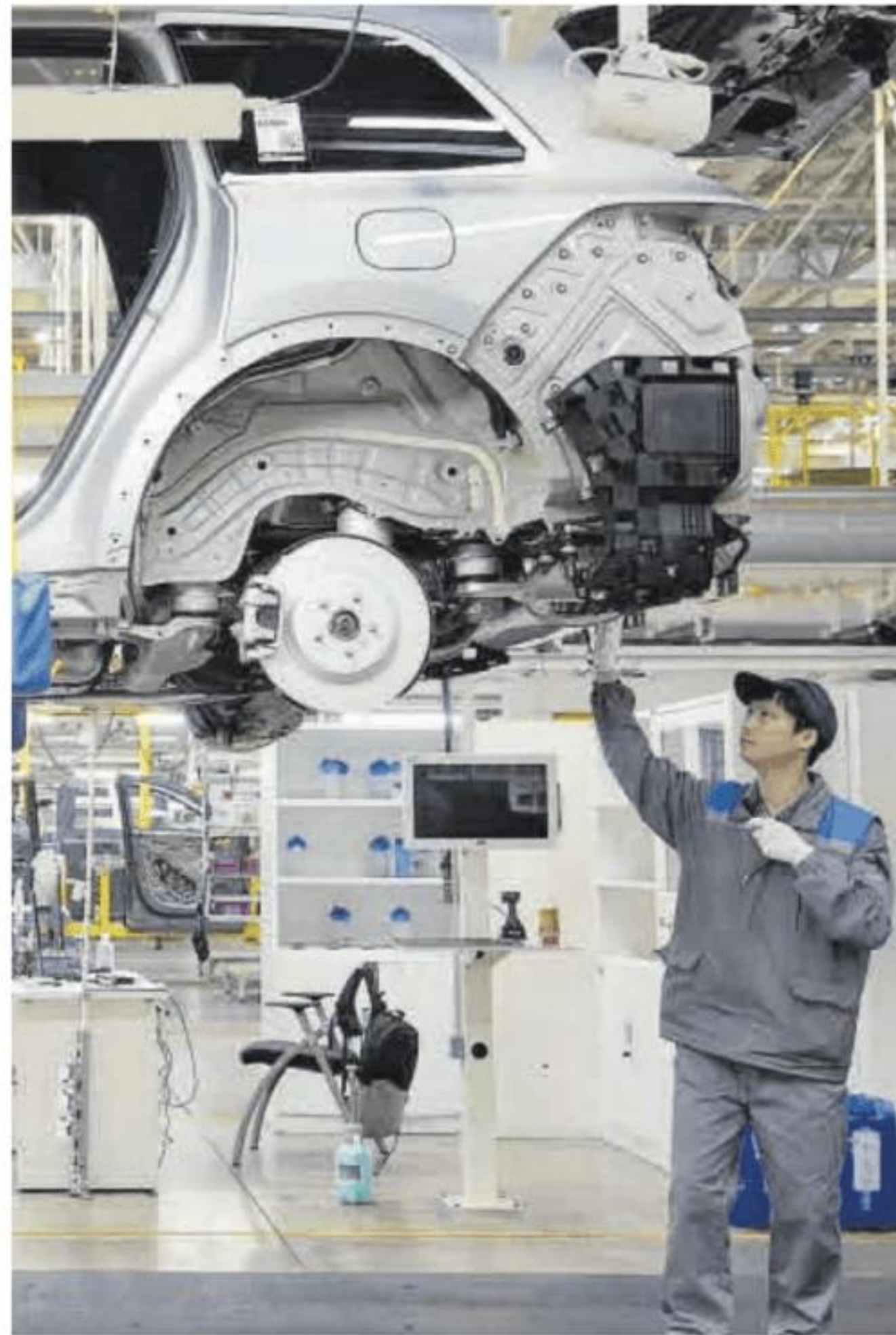
Un trabajador ensambla una pieza en un coche eléctrico en Changzhou.

La lucha por proteger el sector europeo de automoción se remonta a hace un año. La Comisión Europea activó la vigilancia de las importaciones de vehículos chinos tras observar entradas «masivas» de casi 200.000 entre octubre de 2023 y enero de 2024, un 11% más