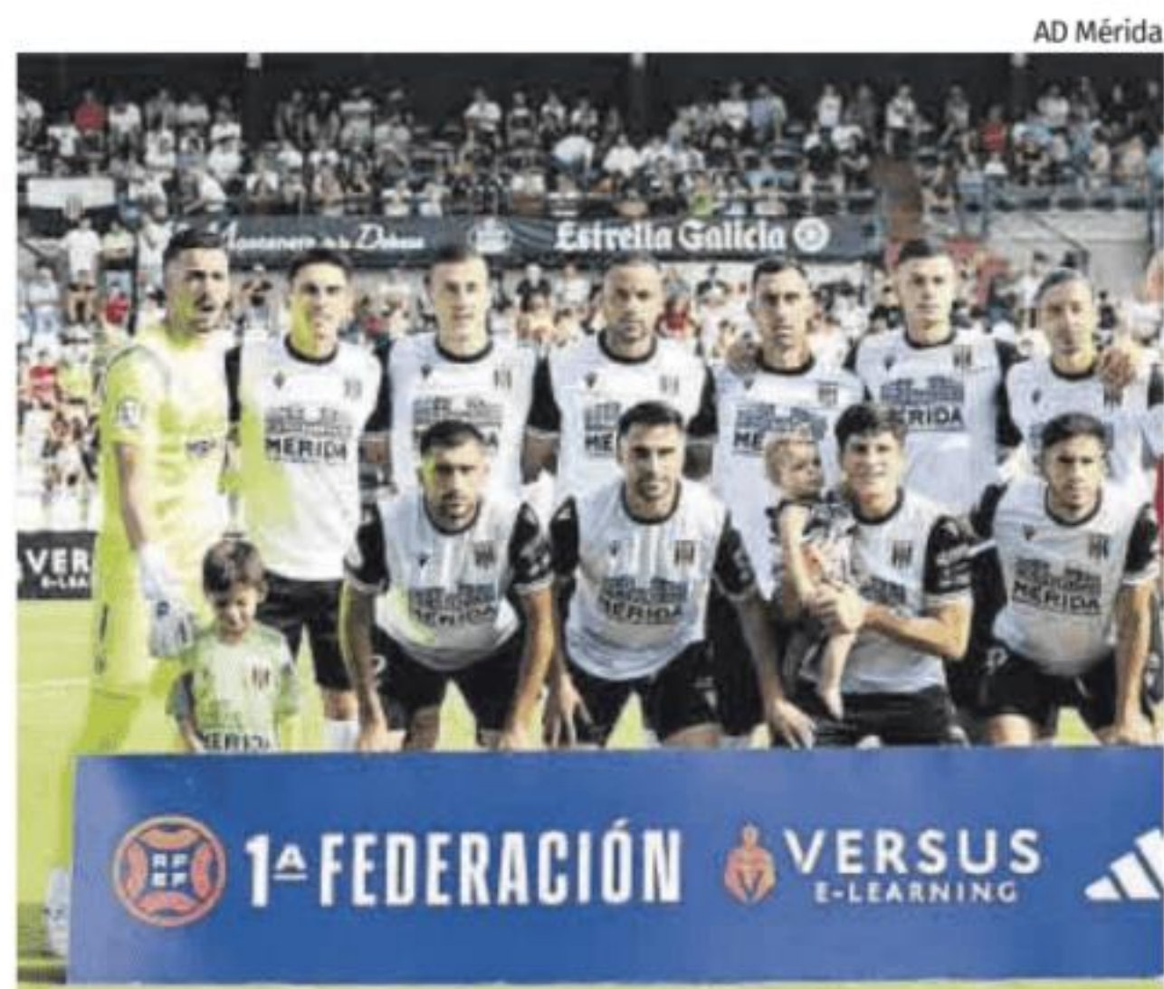
Once inicial del Mérida en un partido de esta temporada.

Sobre el horario, que se repetirá en los dos próximos partidos en casa, «es el que menos me gusta, para la afición también, pero no debe ser excusa».