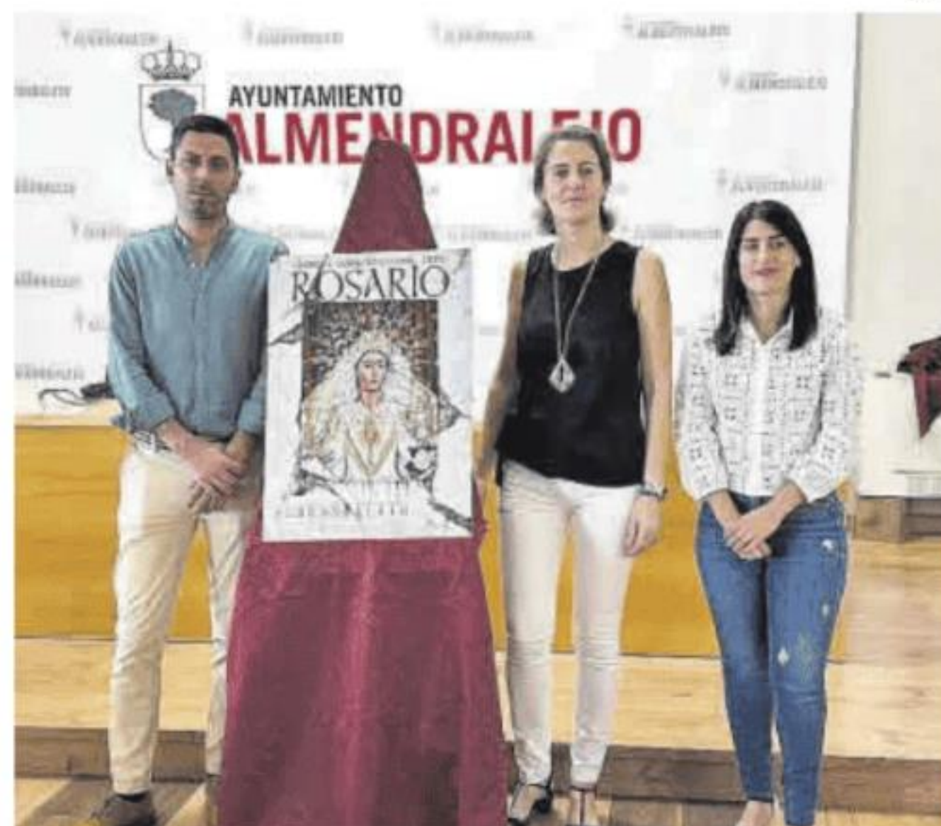
Presentación de cartelería de la procesión del Rosario.