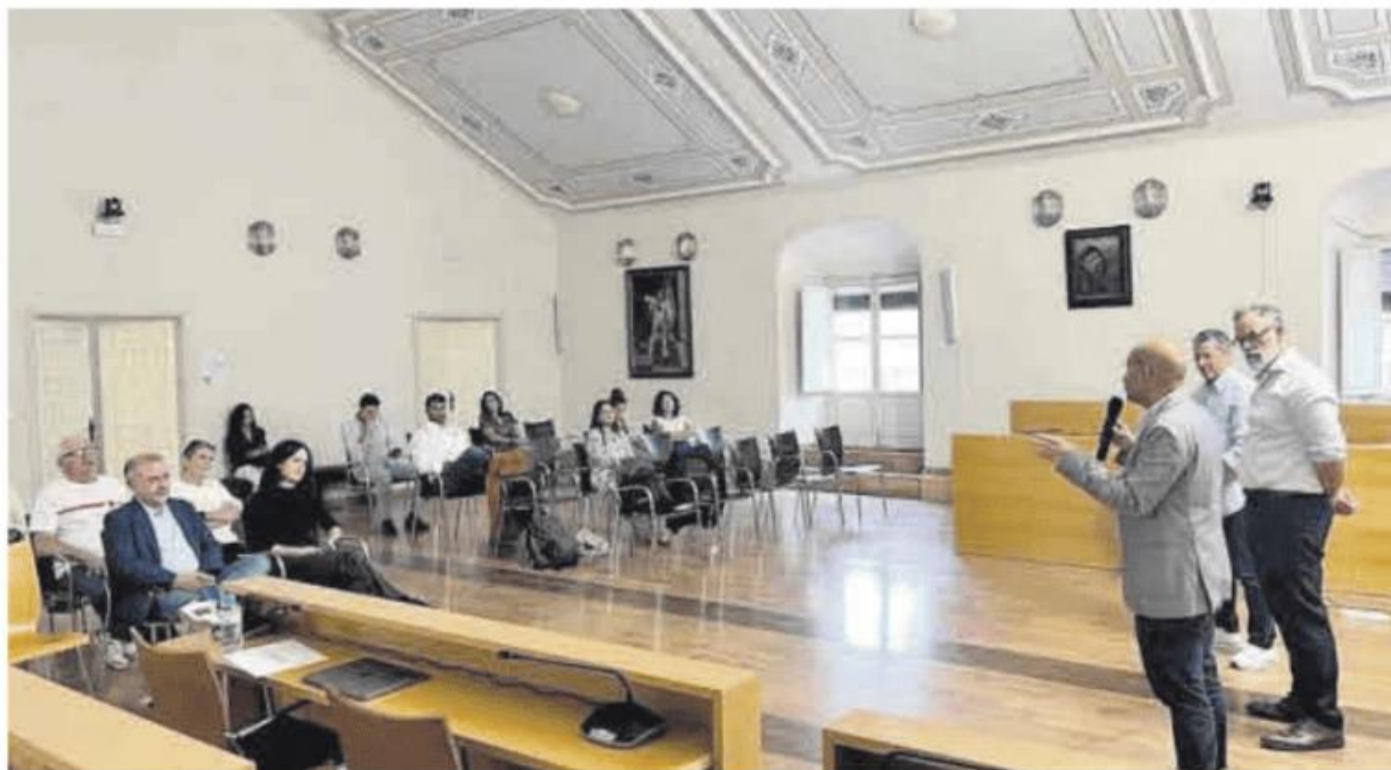
Presentación del programa Colabora en el salón de plenos del ayuntamiento de Almendralejo.

Esta iniciativa de impacto social está asociada a las plantas fotovoltaicas Extremadura que Acciona Energía opera en el municipio. Las sesiones formativas que se imparten giran en torno a competencias transversales para mejorar la empleabilidad de los jóvenes y su capacidad para afrontar desafíos en el ámbito laboral. Además, se llevan a cabo sesiones de acompañamiento para las empresas con el objetivo de aumentar el valor de su modelo de negocio. Posterior-