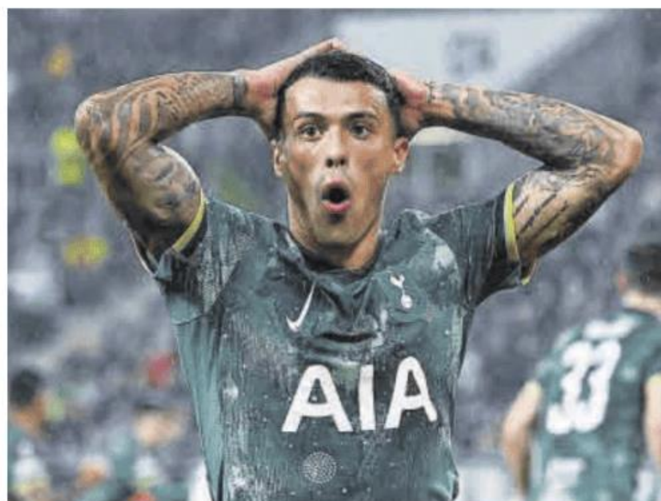
Pedro Porro, con el Tottenham.