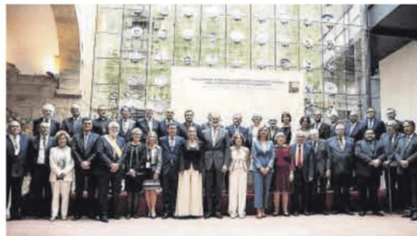
Foto de familia entre los asistentes al acto inaugural.