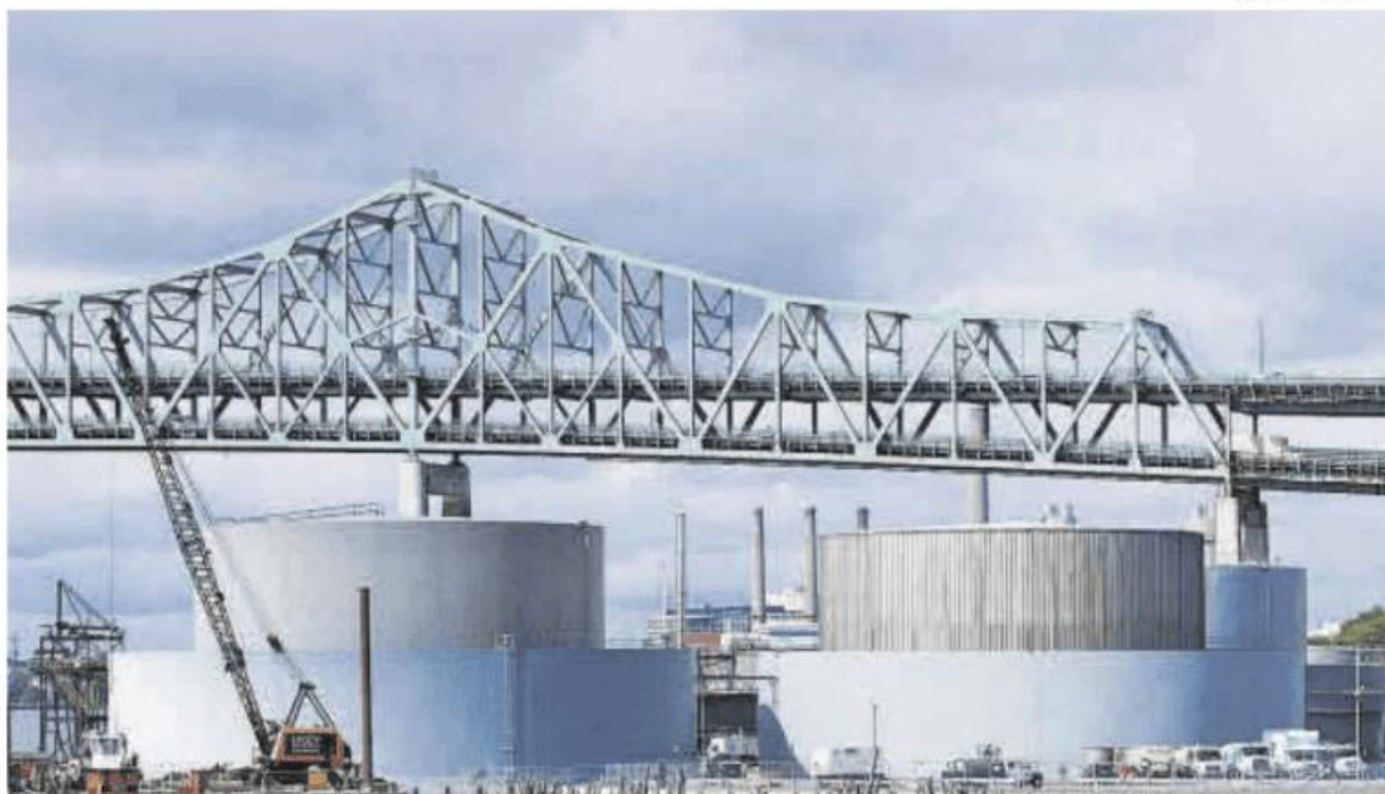
Depósitos de petróleo en un puerto estadounidense, país donde ya se nota en los precios la crisis bélica.