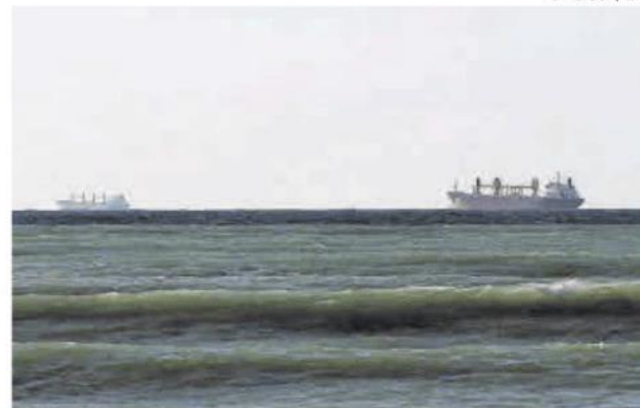
Dos petroleros navegan por el estrecho de Ormuz.