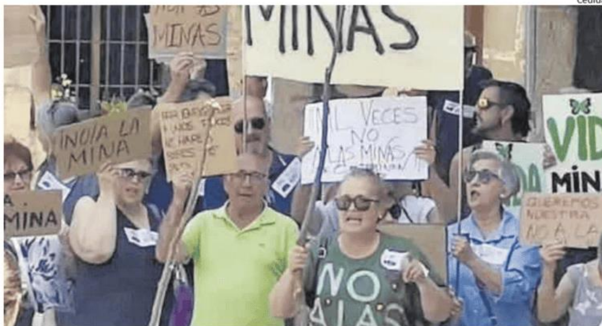
Personas protestando en contra de la explotación minera en Sierra de Gata.

En dichos municipios puedes encontrar carteles de «no a la mina», hay una concienciación social muy «fuerte» y la gente «sobre todo está preocupada por la desinformación», señaló el presidente de la mancomunidad. «No tiene sentido que la Junta no tenga una interlocución más fluida con los municipios afectados» y