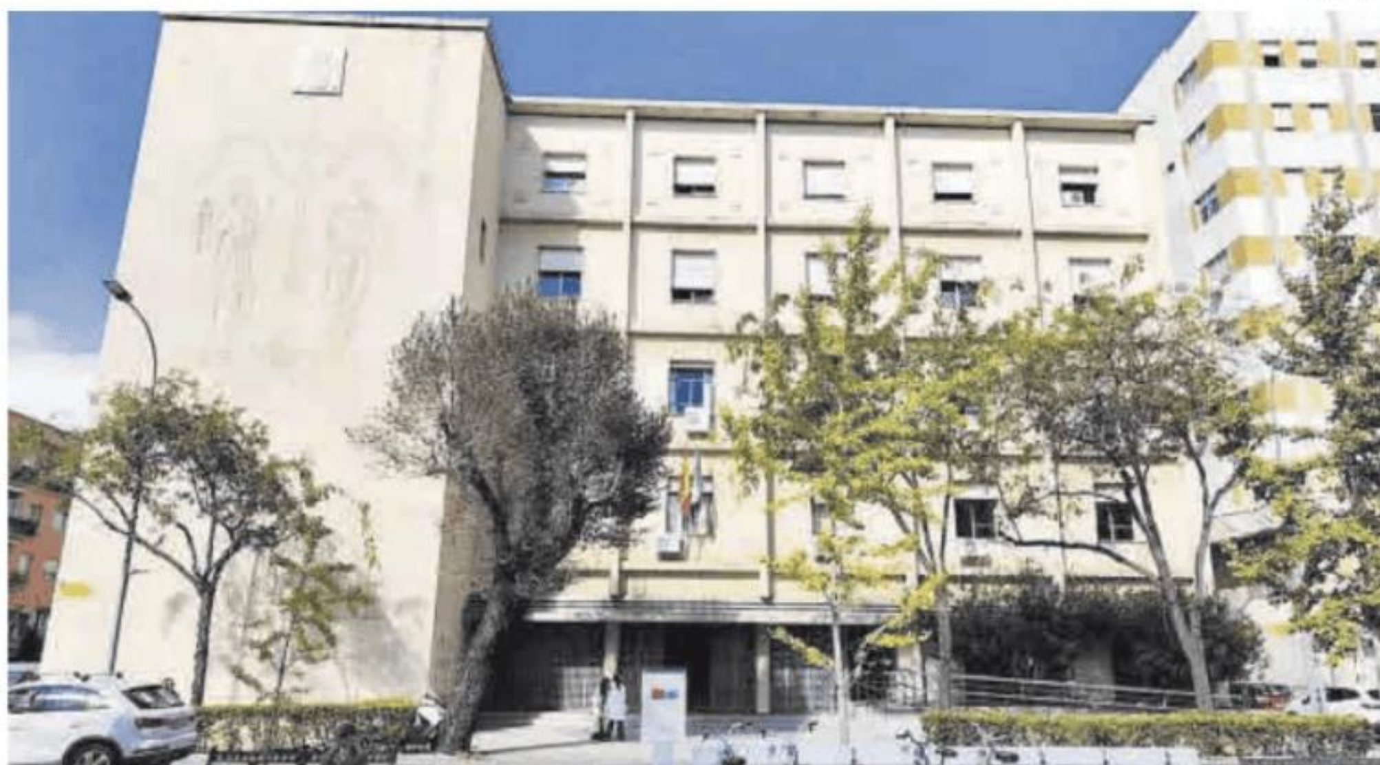
Sede de la Audiencia Provincial de Badajoz.

Habría que recordar que, siete días después del citado sorteo, el joven denunció ante la Policía Nacional a tres personas –a las dos mujeres con las que supuestamente compartía el cupón y a un hombre, familiar de ambas– por presuntamente haberlo obligado «a punta de pistola» a repartir el dinero con las dos primeras, afirmando ser él el único dueño del boleto agraciado. Esa «extorsión», argumenta, le llevó a firmar un contrato tras el cual cada uno ingresó su parte del premio, unos 5,6 millones de euros, en el banco. No obstante, la denuncia del joven