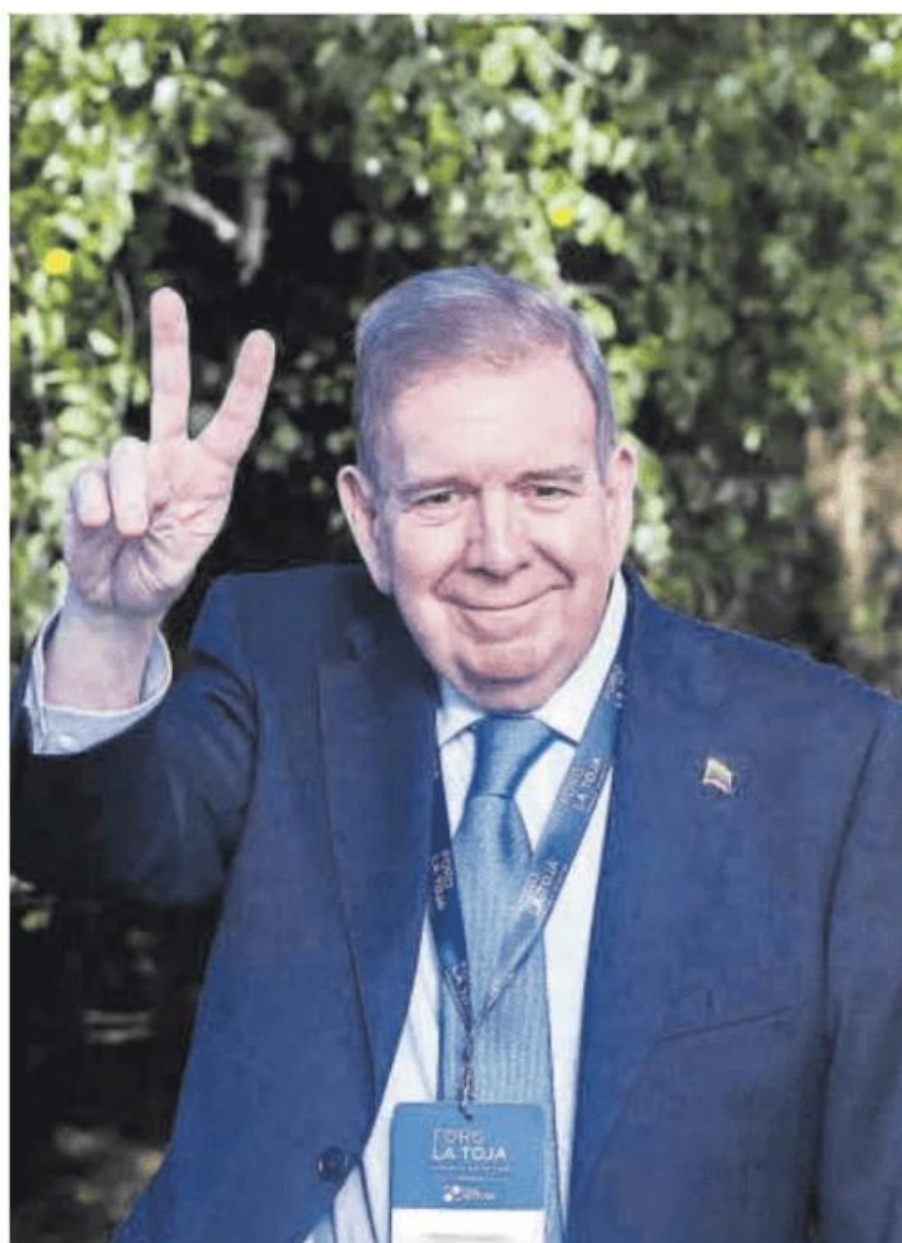
Edmundo González, ayer en el Foro La Toja, en O Grove (Pontevedra).

Albares anunció ayer que el opositor venezolano ha solicitado asilo político de manera oficial en España esta misma semana. Además, informó de que el régimen de Nicolás Maduro ha enviado una nota al Gobierno de España para mani-