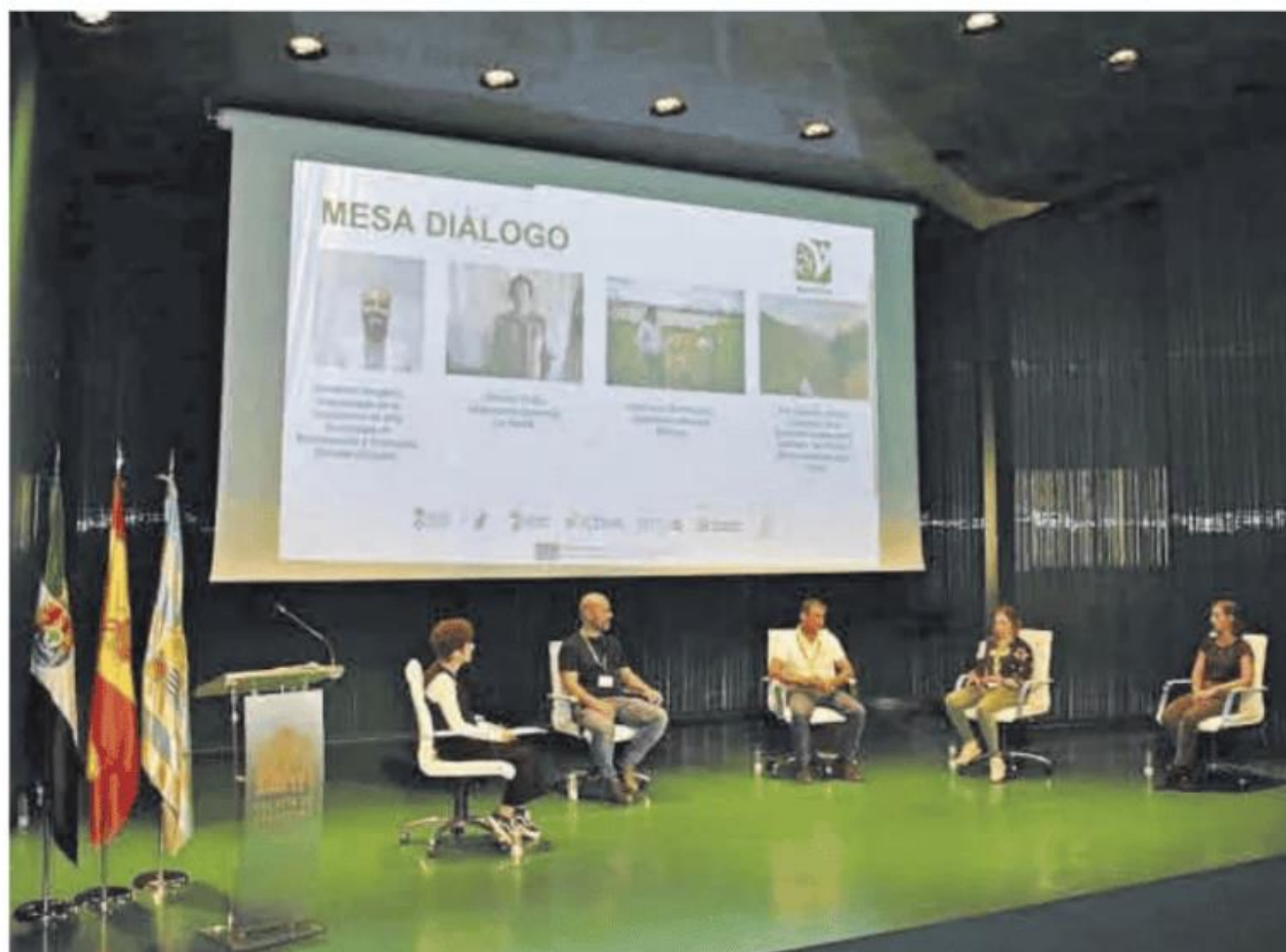
Celebración de las jornadas de Acción contra el Hambre en el palacio de congresos.

También estuvieron varias mujeres ponentes que se reunieron en una mesa de diálogo para presentar sus testimonios como emprendedoras en el ámbito de la agricultura sostenible y agentes del territorio comprometidos con