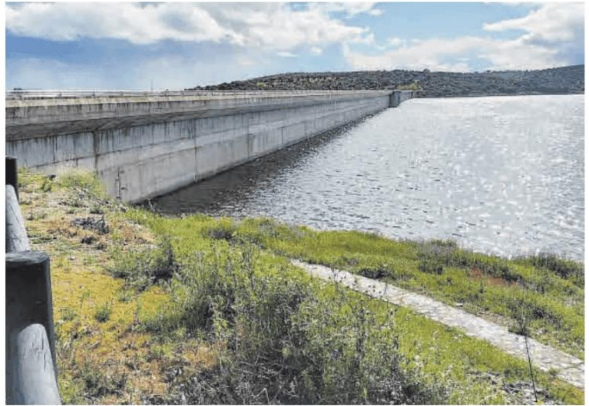
Imagen lateral de la presa de Alcollarín.

Además, desde el PP de Cáceres indican que en el proyecto se incluía la restauración del río Alcollarín y el Arroyo del Peral, así como trabajos para la mejora de la fauna de la zona. A su vez, señalan que tendrían que incluir la construcción de un parque pe-