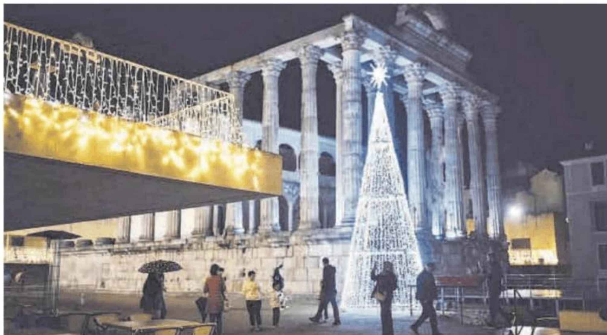
Iluminación navideña instalada en el Templo de Diana, en una imagen de archivo.

Según la información recogida en los pliegos y publicada en la Plataforma de Contratación del Sector Público, las empresas pueden presentar ofertas hasta el 15 de