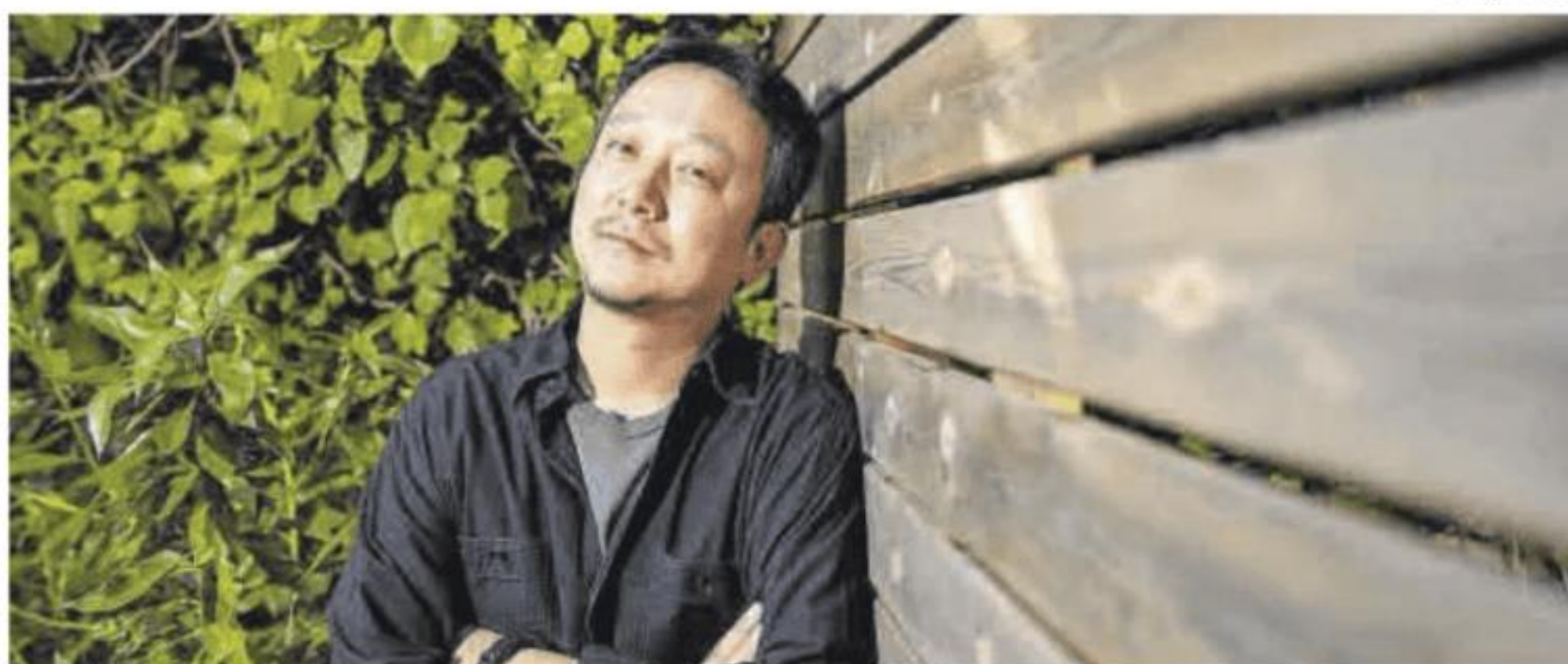
El cineasta surcoreano Jang Jae-hyun, director de 'Exhuma', durante su visita a Sitges.

En este alambicado y denso relato de terror ocultista, una rica familia de Los Ángeles recurre a una chamana coreana (Kim Go-eun, gloriosa heroína de Coin locker girl, vista en Sitges en 2015) y su aprendiz (Lee Do-hyun) para tratar de curar a su primer bebé de la misteriosa dolencia que le hace llorar desde que salió al mundo. Todo apunta a un tipo de maldición, una llamada de la tumba, cuya ruptura requiere el desenterramiento y reubicación de los restos de ese ancestro incómodo en el