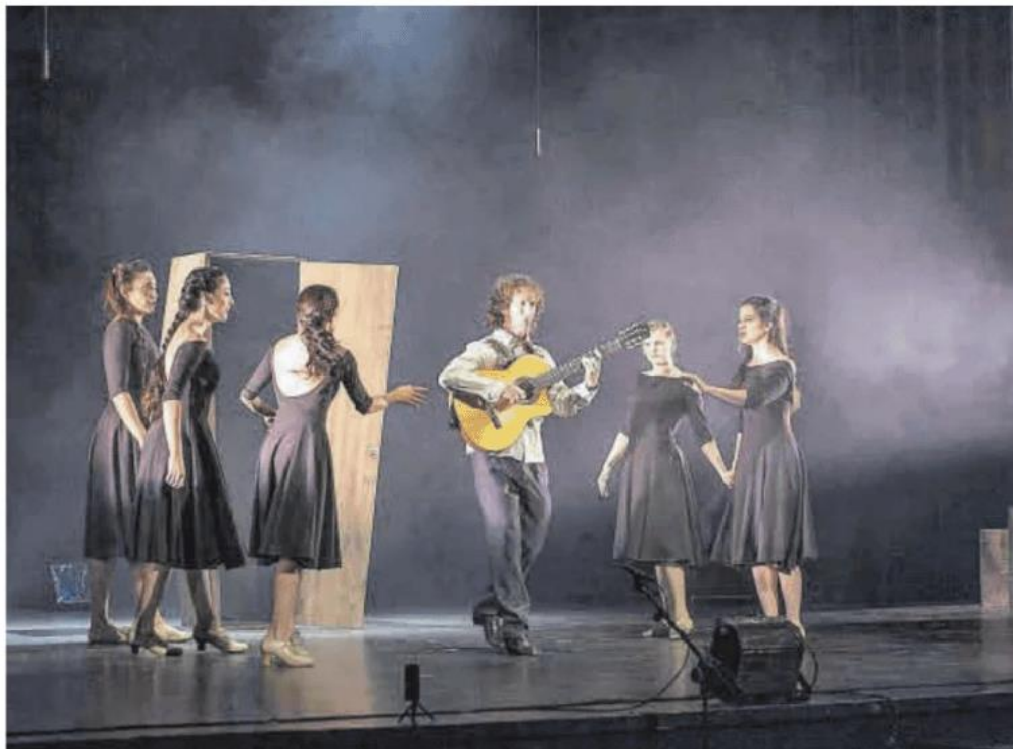
Una representación de la muestra de artes escénicas.

para debatir y reflexionar sobre la situación actual del sector para contribuir a su dinamización y organizar encuentros comerciales entre compañías y programadores y presentaciones breves de hasta veinte proyectos artísticos. Además, la Red de Teatros y otros espacios escénicos de Extremadura