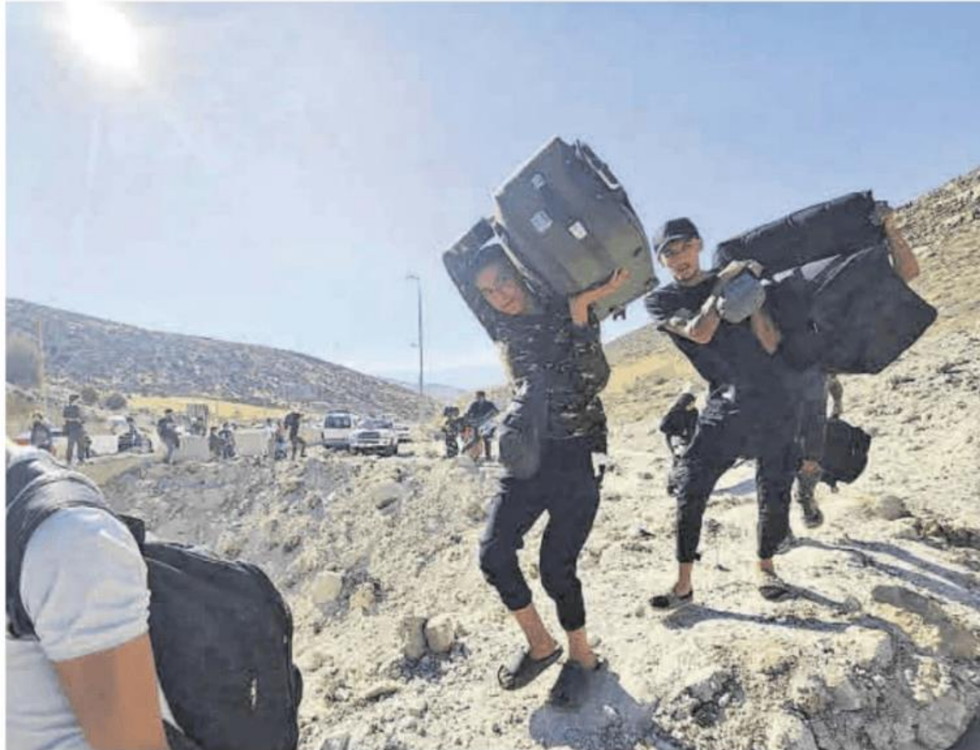
Decenas de personas cruzan a pie la frontera entre Líbano y Siria por el paso de Masnaa, ayer.

Tras un ataque en la entrada del hospital gubernamental de Marjayoun, uno de los principales cen-