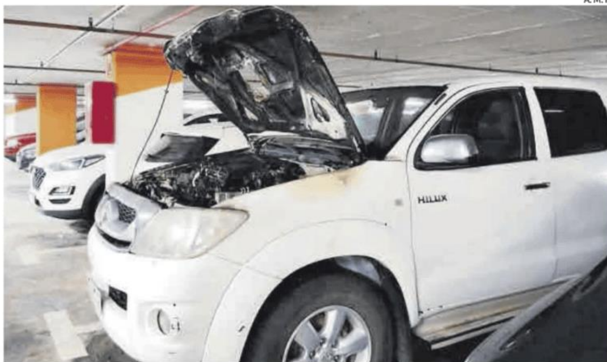
Así quedó el coche. El fuego solo afectó al habitáculo del motor.

de lo que había ocurrido con su coche, contó el dueño, Pedro Manuel. El vehículo tiene 15 años y un seguro a todo riesgo.