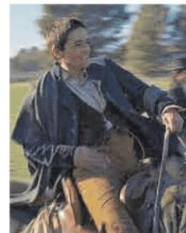
Bebe, en 'Libertad'.