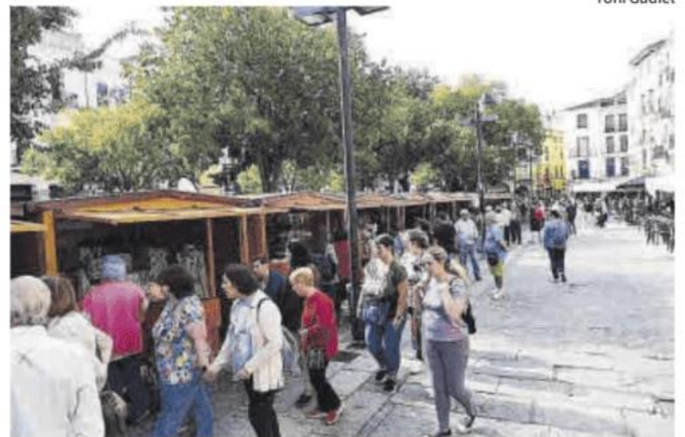
Público visitando las casetas de venta de ropa.