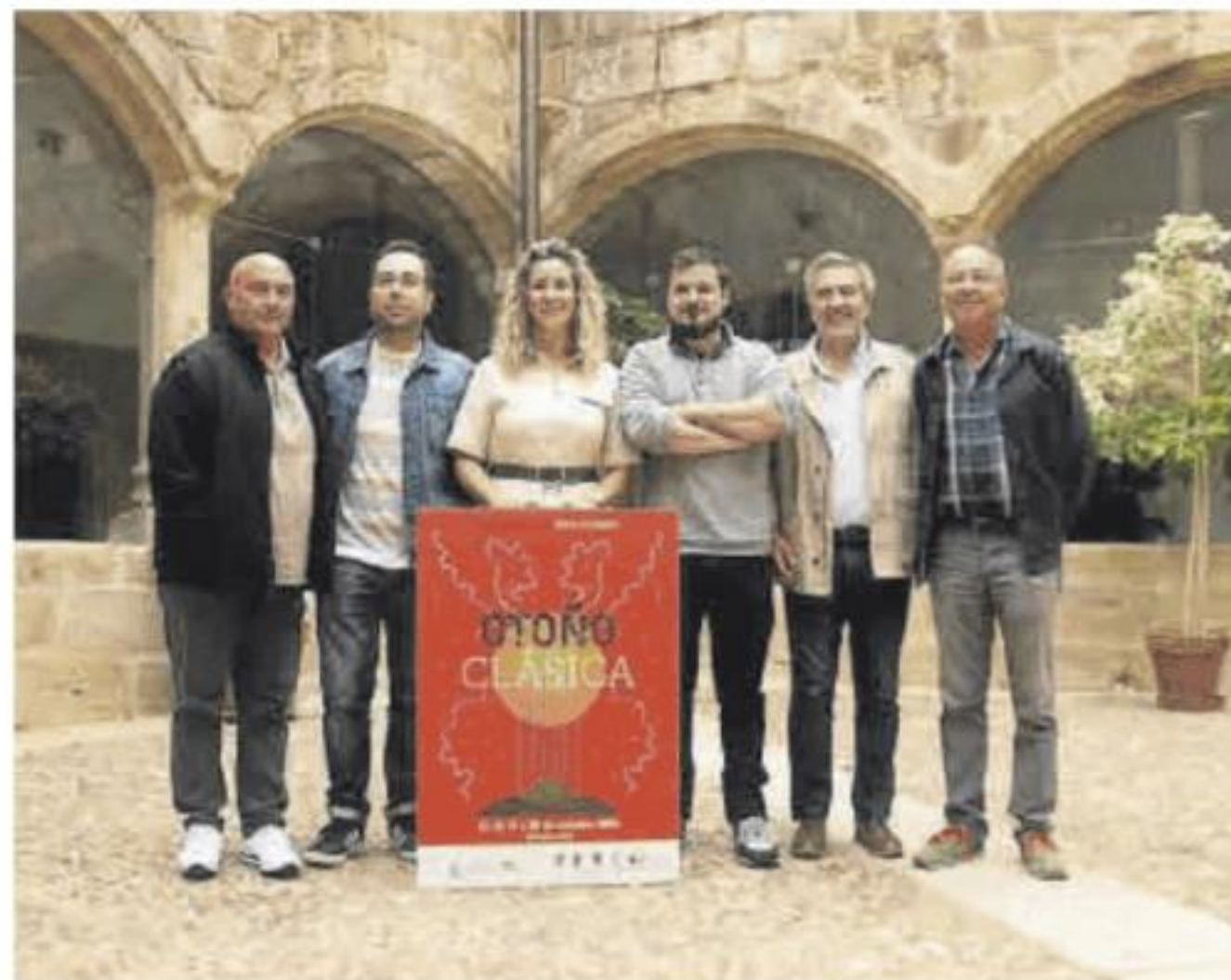
Diputada, alcaldes y organizadores posando junto con el cartel.

agrupación musical cacereña centra su repertorio en el Renacimiento y principios del Barroco.