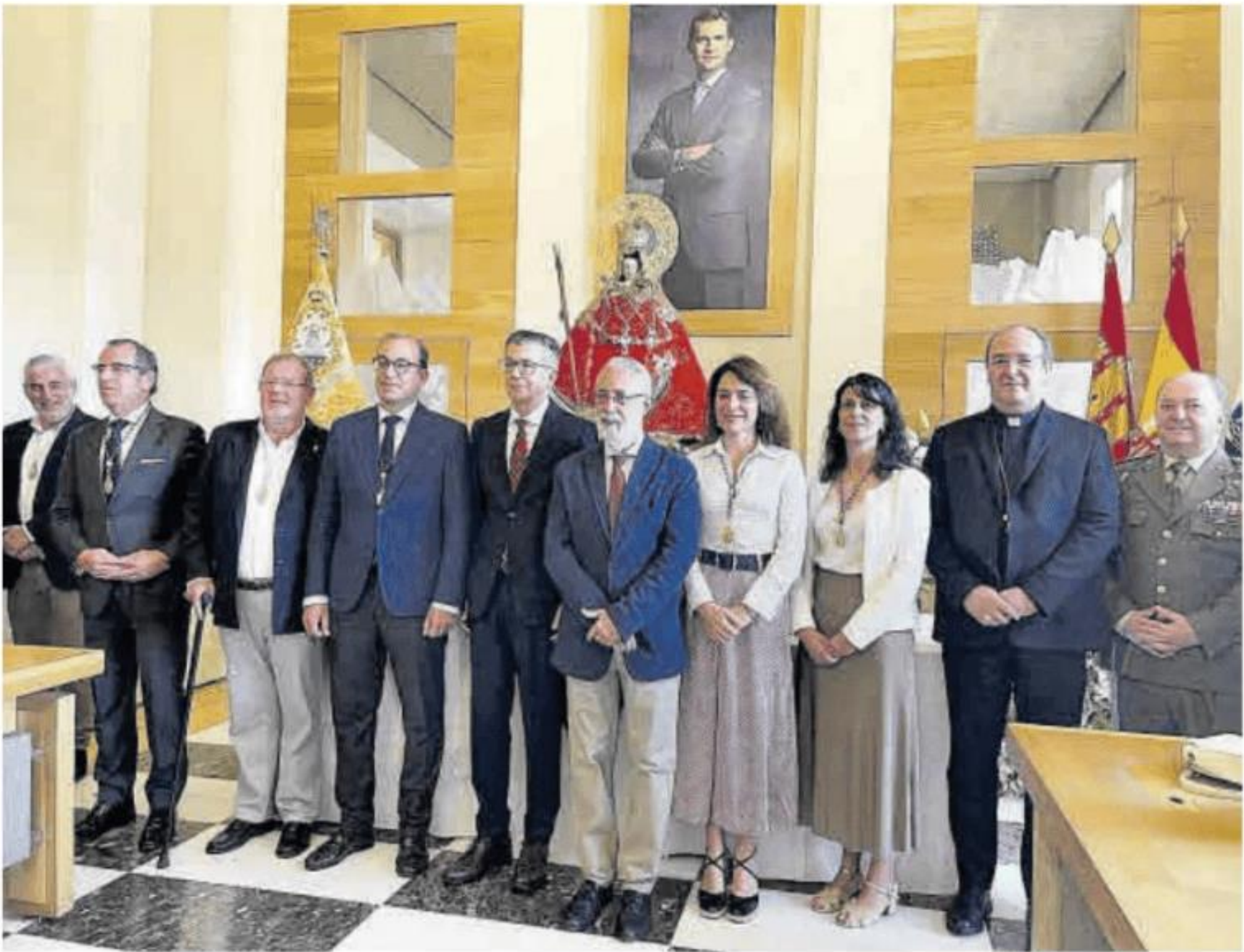
Imagen de la patrona de Cáceres recibida en el salón de plenos del ayuntamiento, este viernes.

después del mediodía harán lo propio Jesús Despojado (María Santísima de la Pureza), la cofradía del Cristo de la Victoria (Nuestra Señora del Rosario en sus Misterios Dolorosos), la cofradía del Cristo del Calvario (Virgen del Rosario), hermandad de la Expiración (Nuestra Señora de la Esperanza), la hermandad del Cristo Amor (Nuestra Señora de la Caridad), la hermandad del Humilladero (Nuestra Señora de la Encarnación), la cofradía de los Ramos (María Santísima de la Esperanza), Sagrada Cena (Nuestra Señora del Sagrario), las Batallas (Nuestra Señora del Buen fin y Nazaret) y Jesús Nazareno (Nuestra Señora de la Misericordia). Una vez que todas las tallas lleguen a Cánovas, arrancará el cortejo a las 18.00 horas por la avenida de España, San Antón, San Pe-