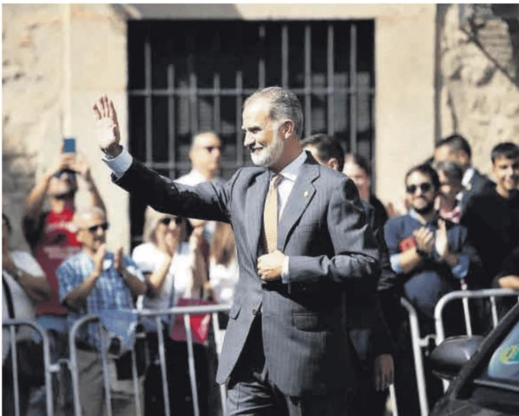
Felipe VI, a su llegada, saluda al público que se aglomera en la plaza de San Miguel de Trujillo.