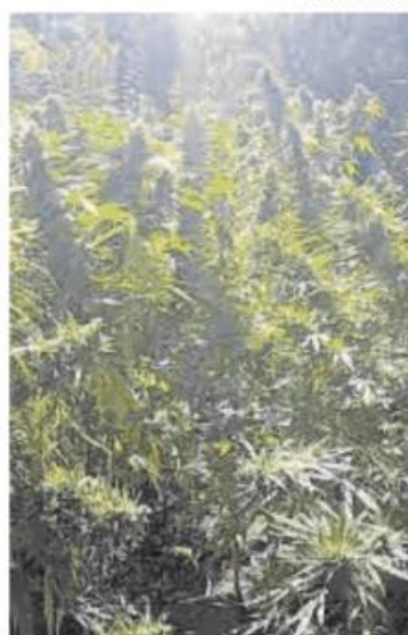
Plantación de marihuana.