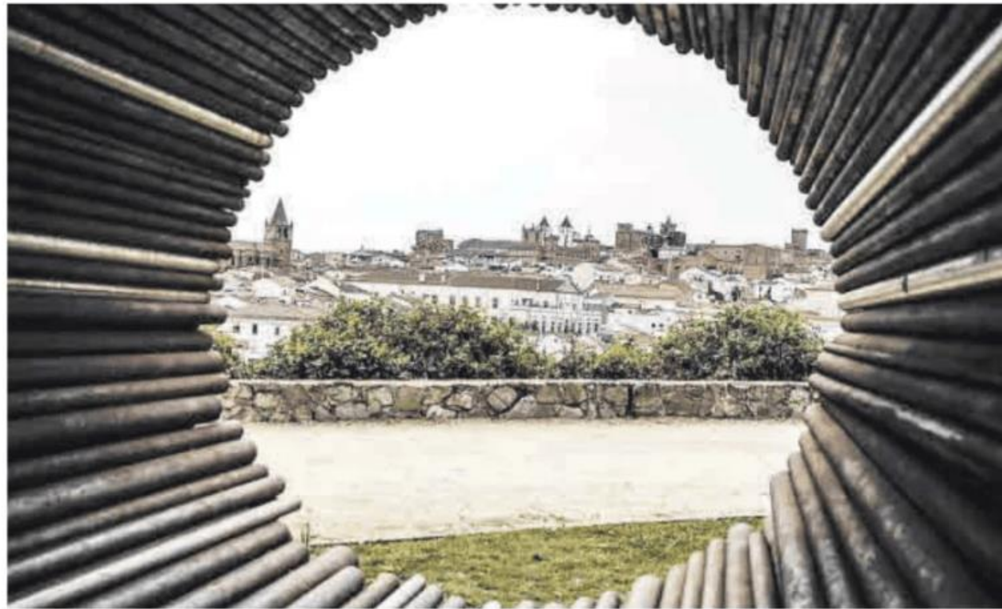
Vista de Cáceres desde el Paseo Alto.

Un documento detallado que desglosa la recaudación de las enti-