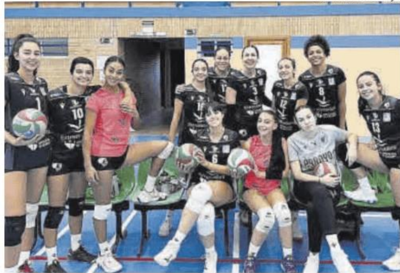
La plantilla del Extremadura Arroyo, durante la pretemporada.