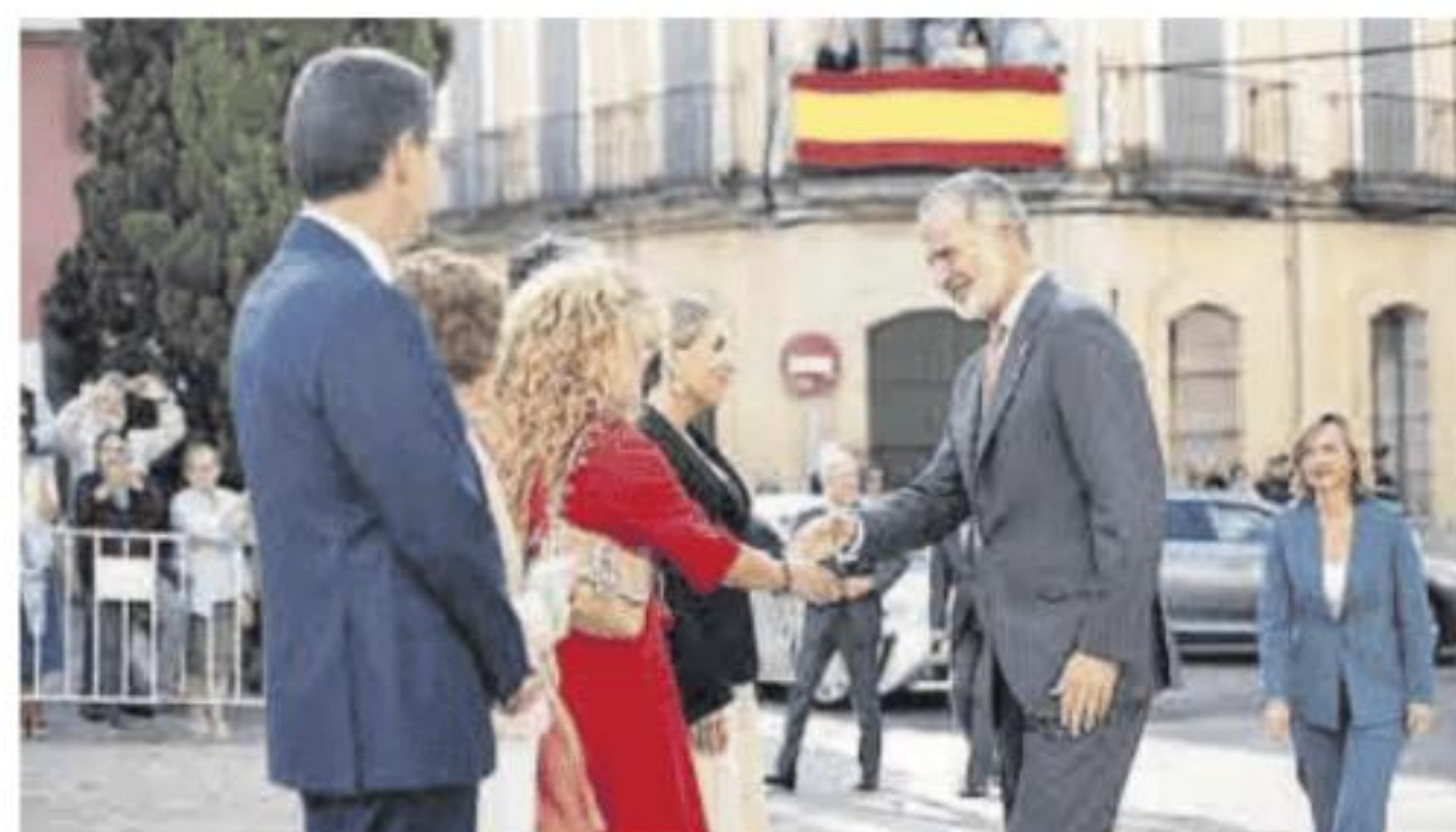
El monarca, con el resto de autoridades que acudieron a la cita.