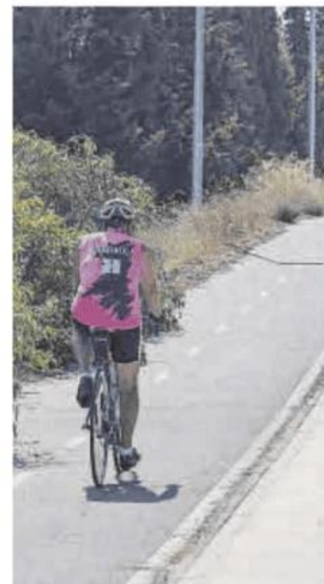
Carril bici en la ciudad.

El acceso se realizará por la segunda glorieta, a la altura del restaurante Montebola.