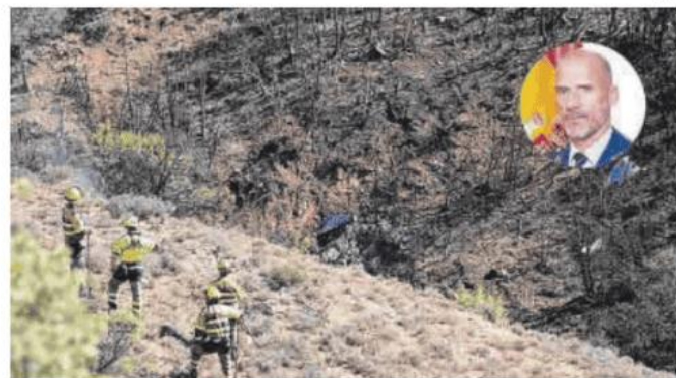
Lugar del suceso y foto del piloto.

Hasta el lugar del accidente se han desplazado efectivos de los bomberos de la Diputación Provincial de Teruel (DPT), aunque por el momento se desconocen las causas del accidente, que se ha producido en torno a las 13.00 ho-