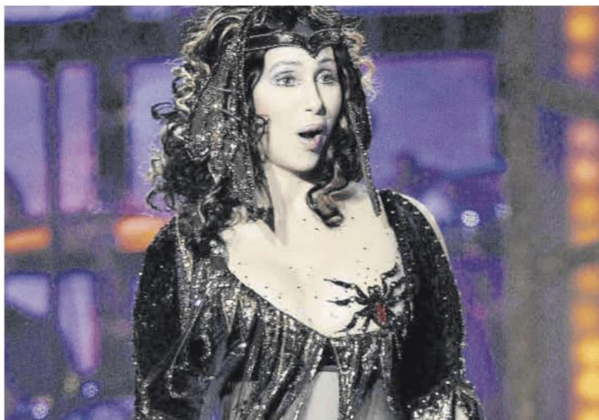
La cantante Cher, durante un concierto en Toronto el 31 de octubre de 2003.

El fenómeno es internacional y lo vamos a ver en breve, el 15 de octubre, en el resucitado desfile de Victoria's Secret, que ha fichado a Cher, la diva inmortal de la música y «la madre de la moda», para tratar de dar un giro definitivo a la mala imagen que se ha ganado en la última década la firma que lo fue todo en lencería a finales de los 90 y hasta principios de este siglo. Su famoso desfile de top aladas, los