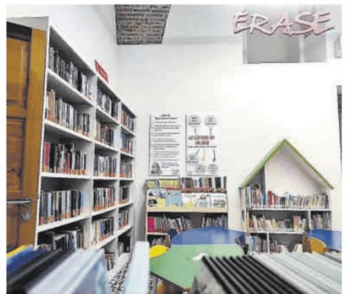
Sala de lectura infantil de la biblioteca municipal de Coria.

Por ello, desde la biblioteca han transmitido esta información en un documento para que cada alumno lo lleve en sus mochilas, con datos del horario y la web de la biblioteca. Además habrá una exposición de marcapáginas. ■