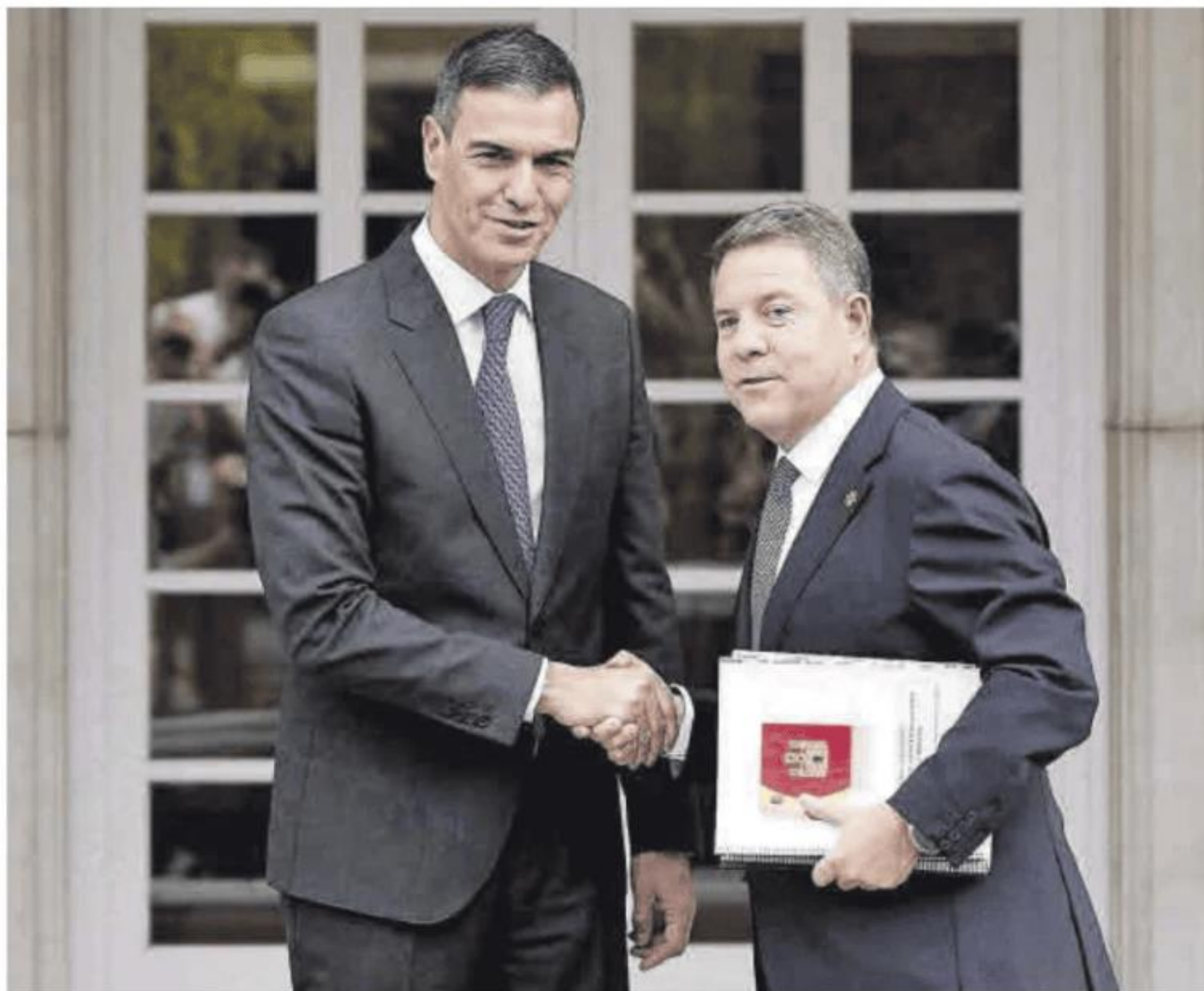
Pedro Sánchez recibe al presidente de Castilla-La Mancha, Emiliano García-Page, ayer.

El Ejecutivo tiene el compromiso de convocar este foro multilateral con las comunidades autónomas antes de la conferencia de presidentes, prevista para principios de diciembre. Sobre el fondo transitorio, Torres aseguró que el Gobierno toma nota de la petición, pero advirtiendo, en alusión a los barones populares, de que es incompatible «que se soliciten fondos a la vez que se disminuyen ingresos porque se bajan ingresos a las rentas altas».