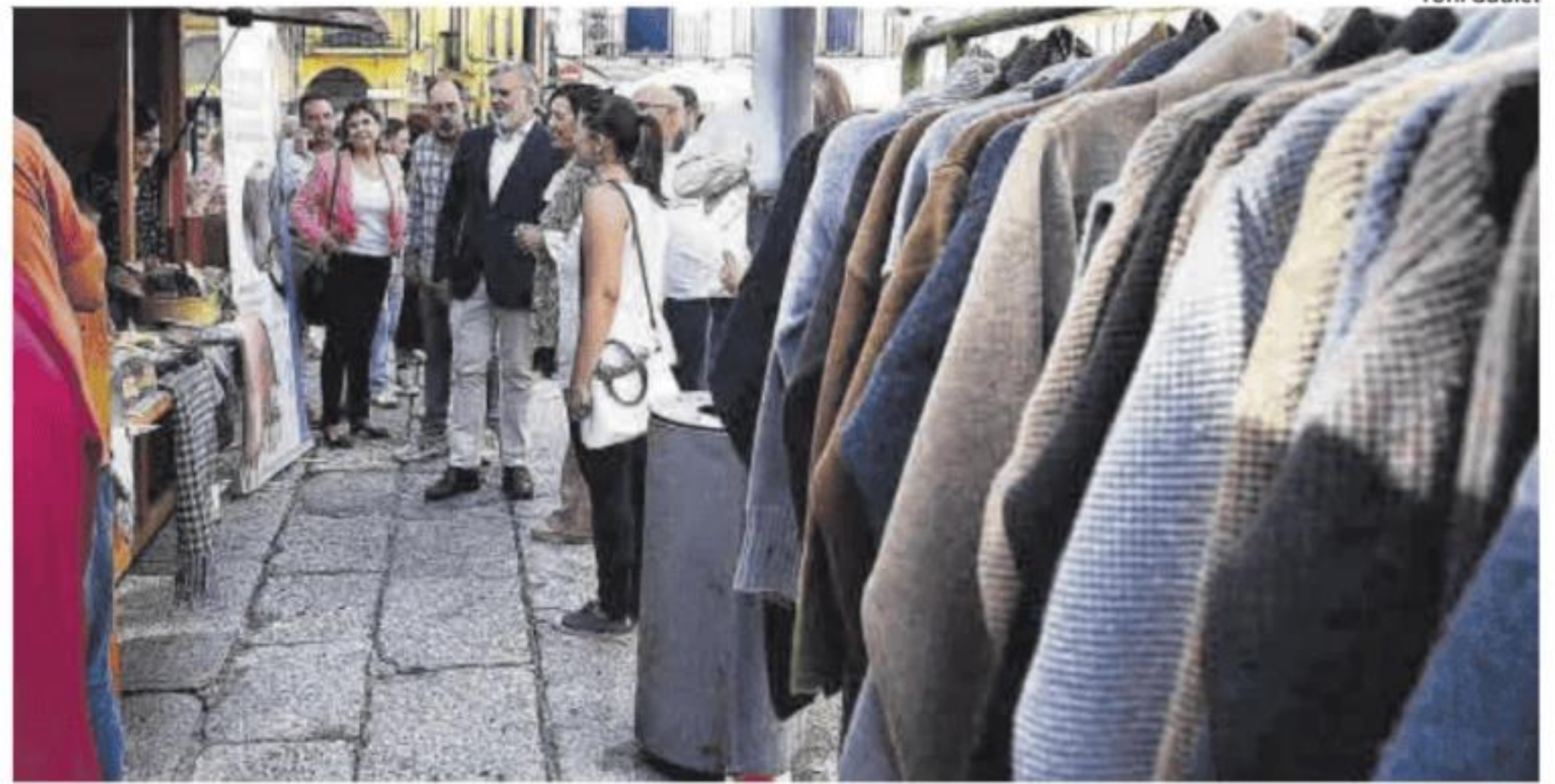
Visita de las autoridades a los puestos de venta.