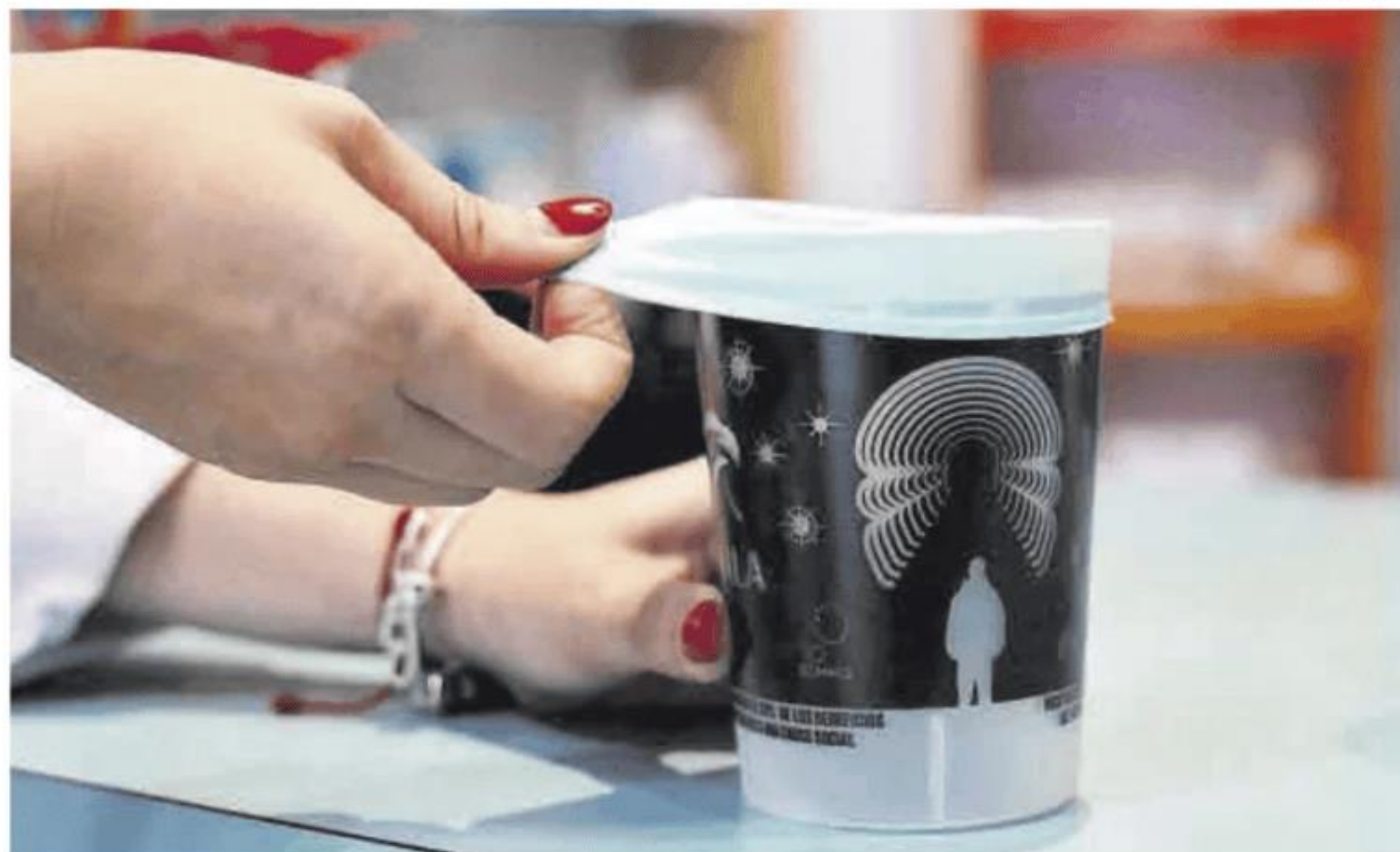
Una mujer se dispone a retirar la tapa de una bebida.

Este epidemiólogo, profesor en el departamento de Salud Pública y Materno-Infantil de la Universidad