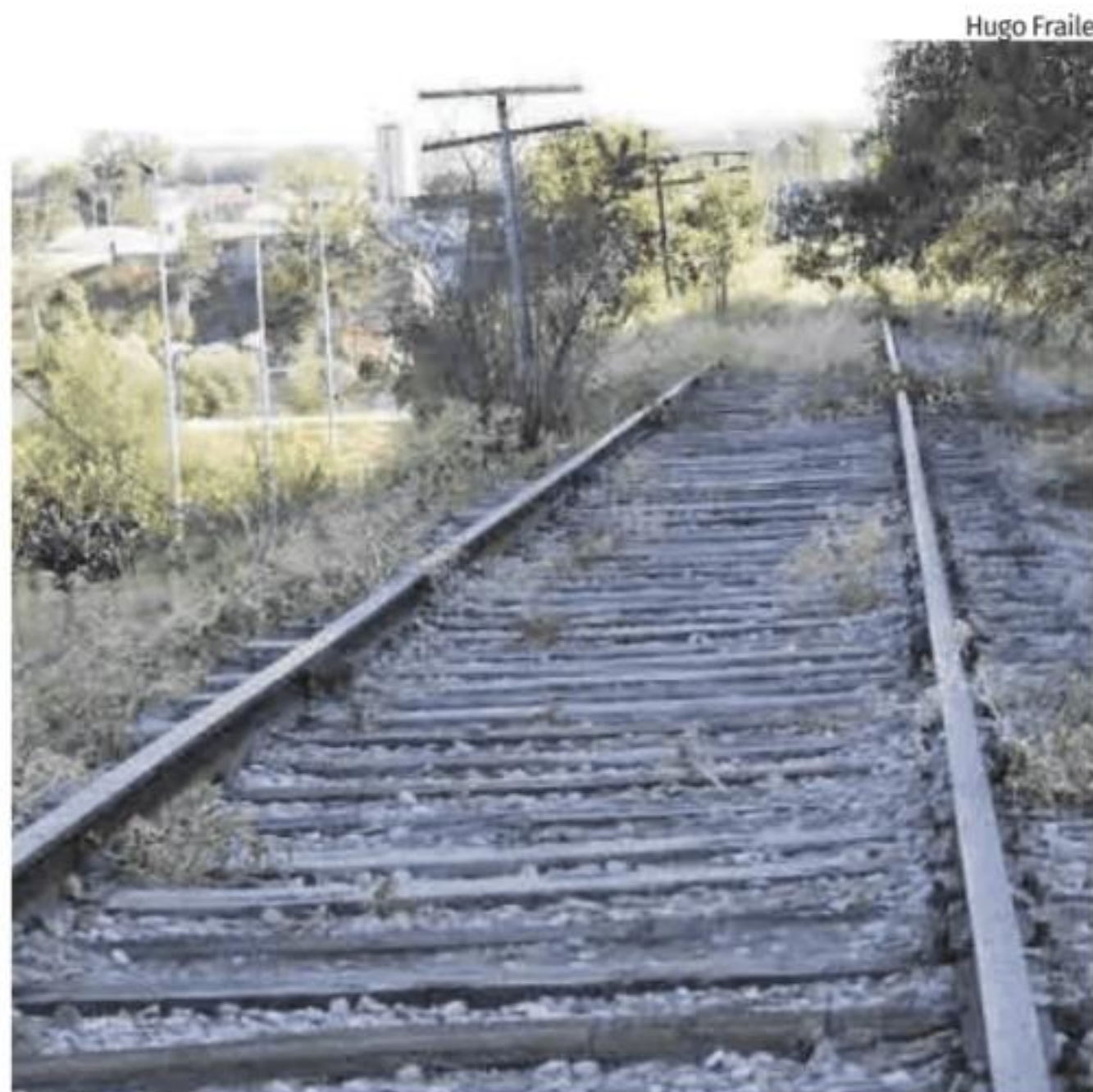
Vías abandonadas del trazado ferroviario Ruta de la Plata.

Este pacto se plantea además con «objetivos claros», que pasan por concretar con el Gobierno de España la ejecución de las principales in-