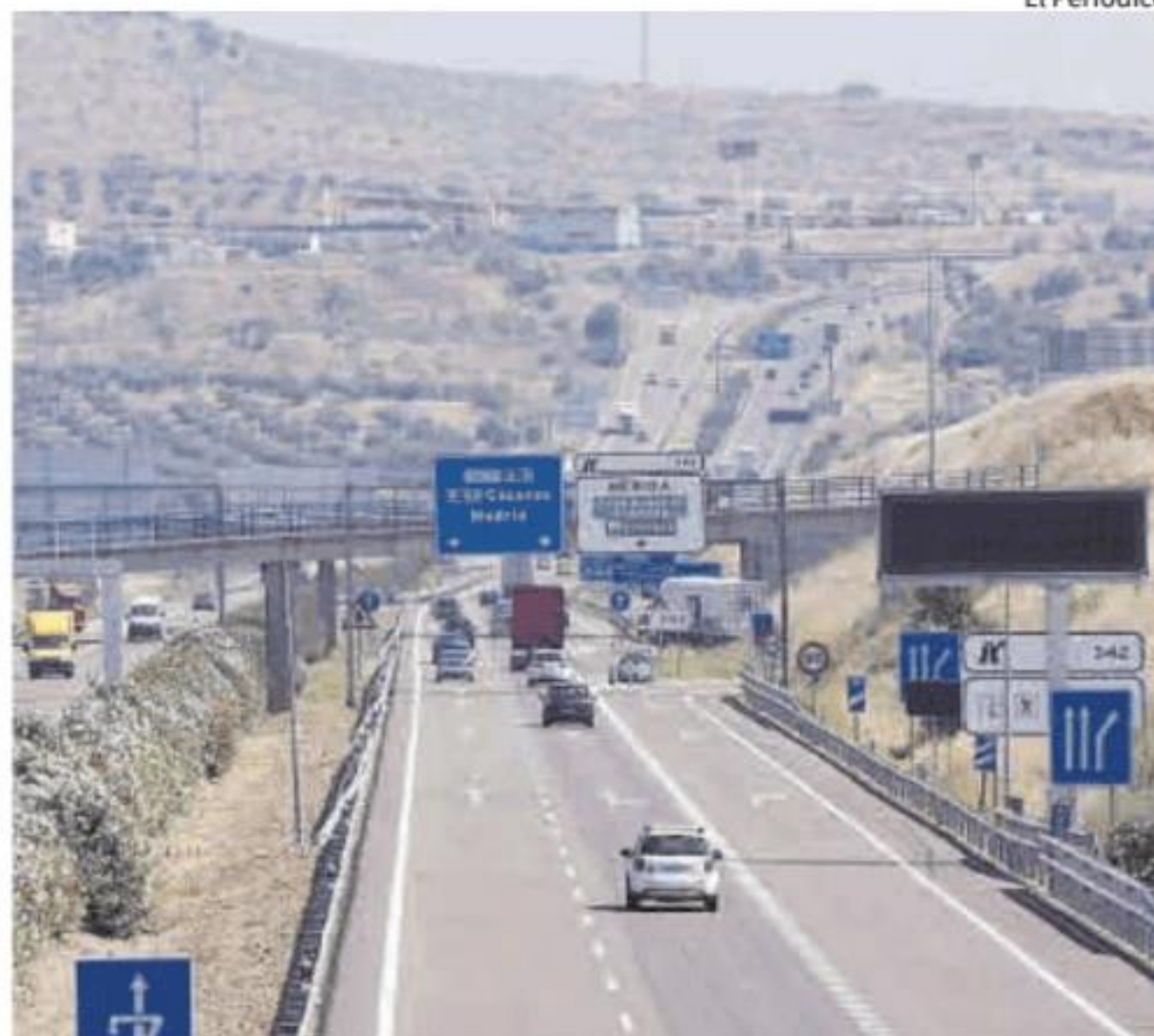
La autovía A-5 a su paso por Mérida, en una imagen de archivo.

prendió, provocando la rotura de los neumáticos en al menos 11 turismos y dos camiones. Afortunadamente no hubo que lamentar daños personales pese a la situación de peligro, agravada por la niebla. A medida que pudieron ir reparando las ruedas, los afectados continuaron con sus viajes. ■