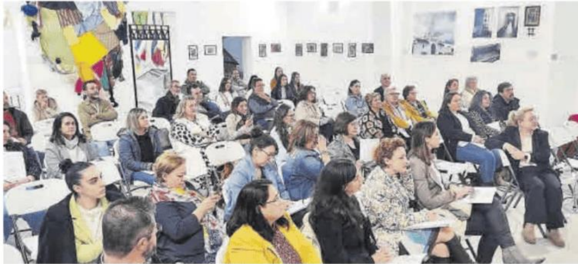
Asistentes a la presentación de la acción formativa, con mayor presencia de mujeres.

Las sesiones incluirán talleres prácticos, charlas con expertos y actividades interactivas que per-